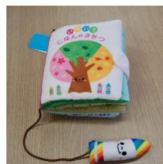
たのぬのえほん さわって楽しむ布絵本

えすでいーじーず SDGs やネットに関するこ とを分かりやすく説明した本 も入りました！