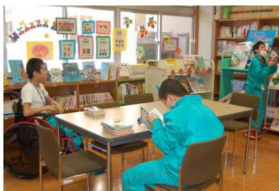
とくしよ たの さっそく読書を楽しんでいます♪