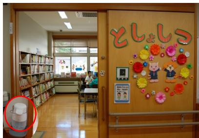
としよしつ はい とき しゅししやうどく 図書室に入る時は手指消毒をしよう

ねんいじやう なが あいだしんがた かんせんしやうたいさく 3年以上もの長い間 新型コロナウイルス感染症対策のため、 じどうせいと みな としよしつ しよう 児童生徒の皆さんはクラスごとに図書室を使用していました はる よやくせいげん ひるやす じゆうじかん が、春からはようやく予約制限なく、お昼休みなど自由時間に りやう す ほん よ しら 利用できるようになりました。好きな本を読みたい、調べ がくしゅう べんきやう とき 学習をしたい、勉強をしたいなど、図書室に行きたい時は せんせい つた き しゅししやうどく ひつやう かんせんしやう 先生に伝えて来てください。手指消毒など、必要な感染症 たいさく おこな としよしつ りやう たの 対策を行いながら図書室の利用を楽しみましょう。